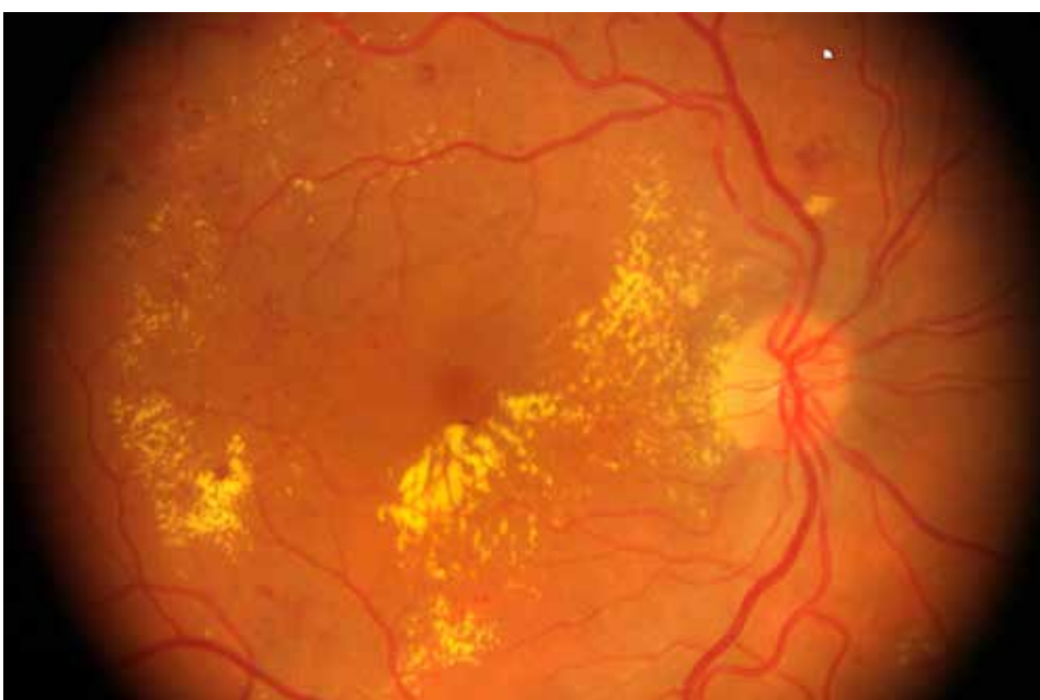
Edema Macular Diabético

Assumindo que o acompanhamento da saúde visual da população portuguesa deve ser feito mediante “rigor, qualidade, seriedade e profissionalismo”, é de forma clara que o GER sublinha a importância de que o rastreio da RD dever ser efetuado exclusivamente por ortoptistas (técnicos de diagnóstico e terapêutica há muito reconhecidos pelo Ministério da Saúde). Esclareça-se que “estes técnicos estão integrados nos hospi-